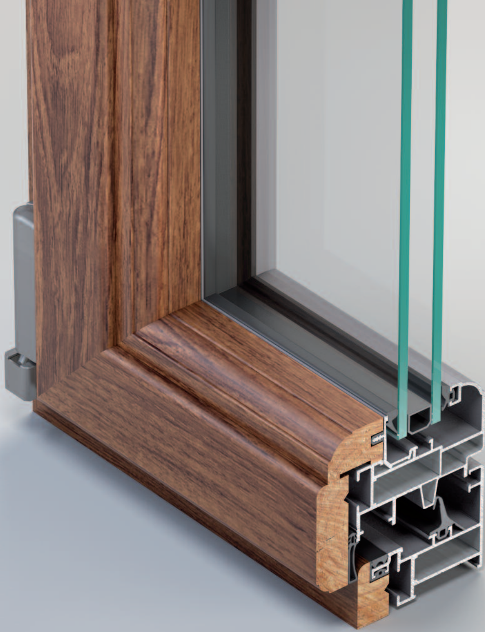
Finestre e porte in Alluminio-Legno